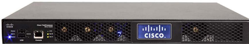
图 2. 思科网真 MCU 5300 系列基于标准，并兼容所有主要供应商的终端